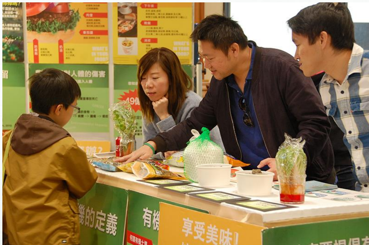
教育要從小做起！座談會旁擺設慈心攤位、有機土及不鏽鋼吸管、餐具等多樣環保產品