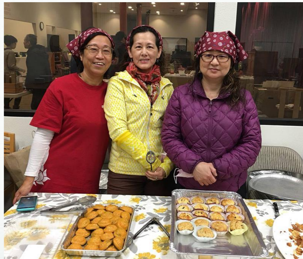
塑膠製品固然不好，但一次性使用的紙盤紙杯同樣製造大量的垃圾，此次座談會採用瓷杯瓷盤供眾使用，會後果然是「零垃圾」