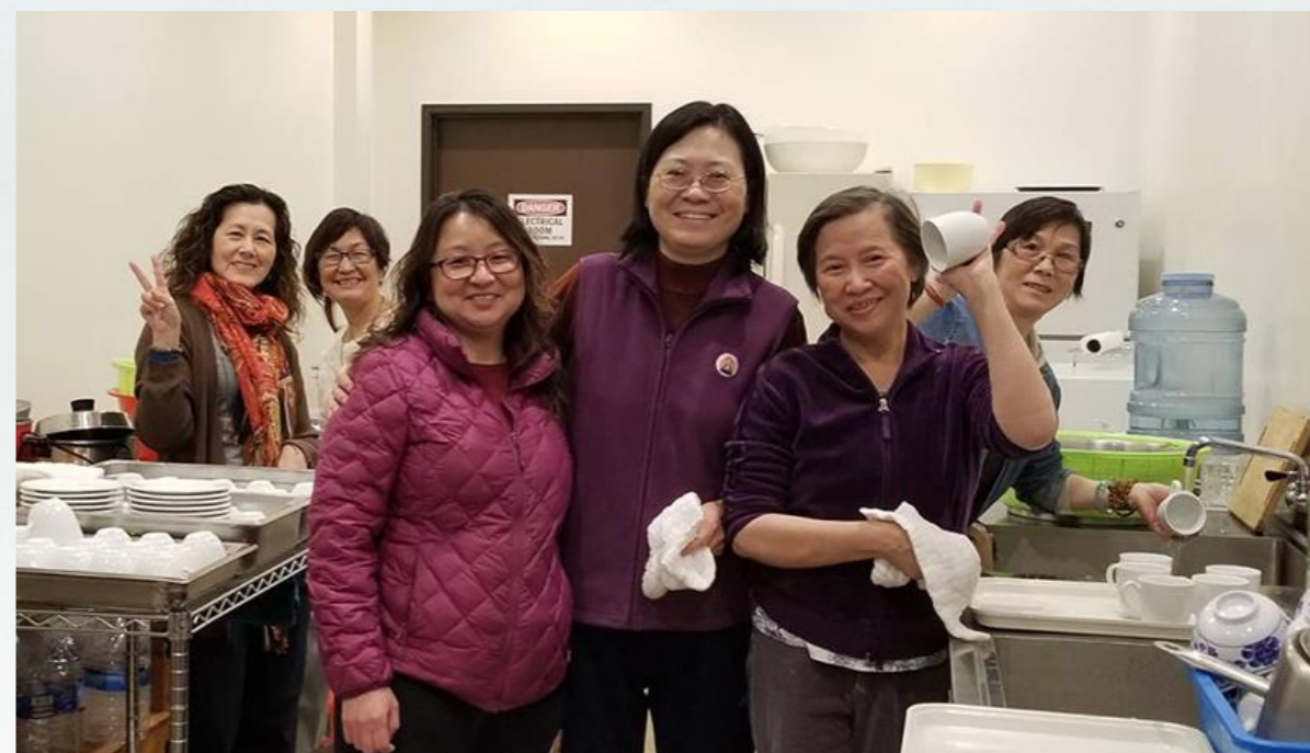
同學們非常歡喜幫忙清洗餐具做善行