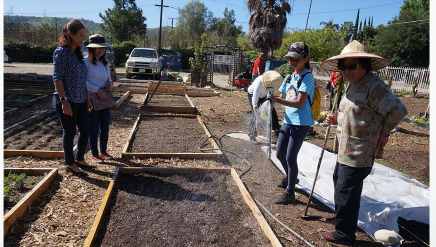
Torrance 學員利用春假期間一起到小鸚鵡農場護持一畝田，期待不久之後的收成！